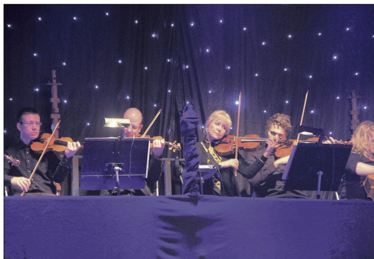
ORKESTER: Bakerst på scenen var strykeorkesteret plassert på en oppbygd «balkong».