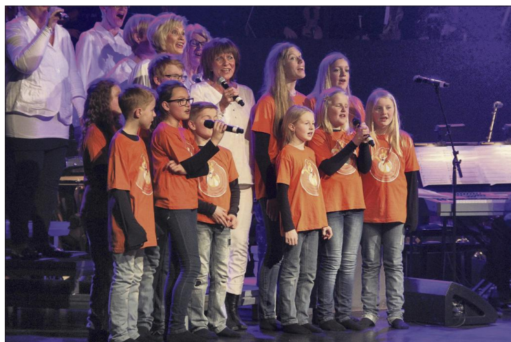
BARNEKOR: Sangere fra Prosjektkoret var også med og satte farge på forestillingen.