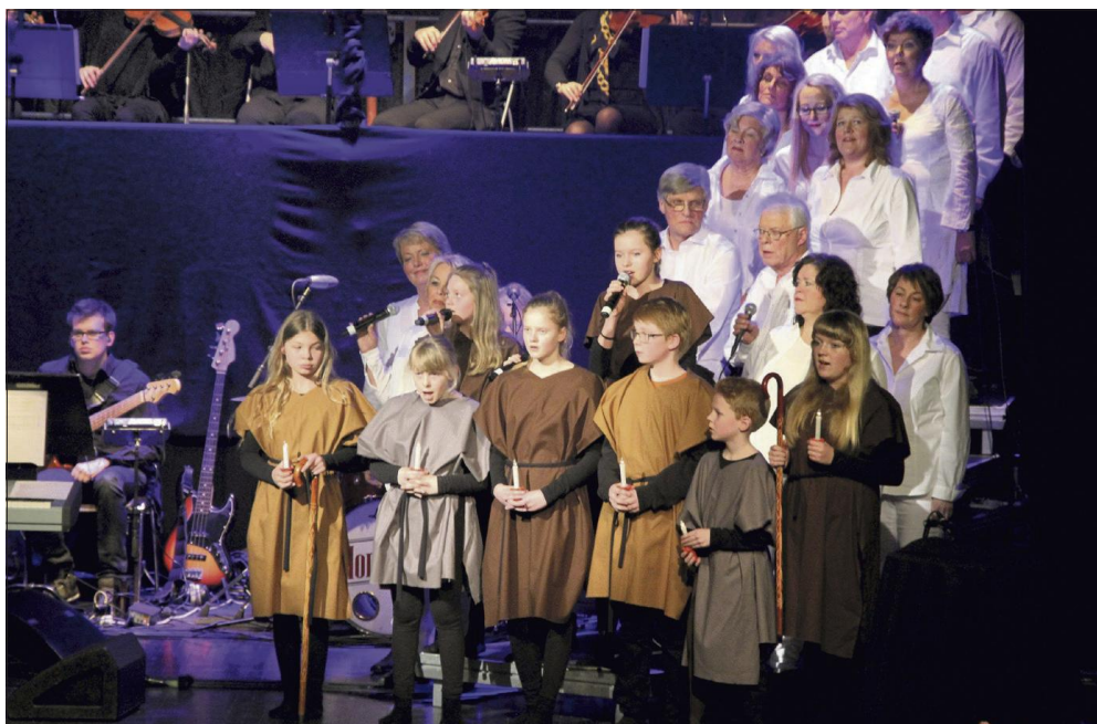
TOONS FOR CARTOONS: Swinglett hadde fått med seg både dansere, barnekor, solister og stort orkester.