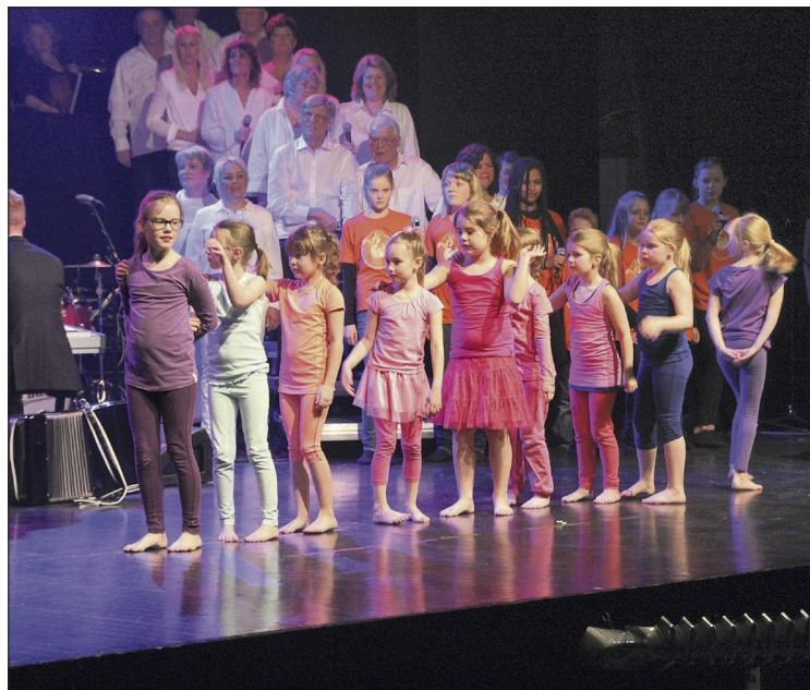
DANSERE: små dansere fra Danseløven ballettskole.