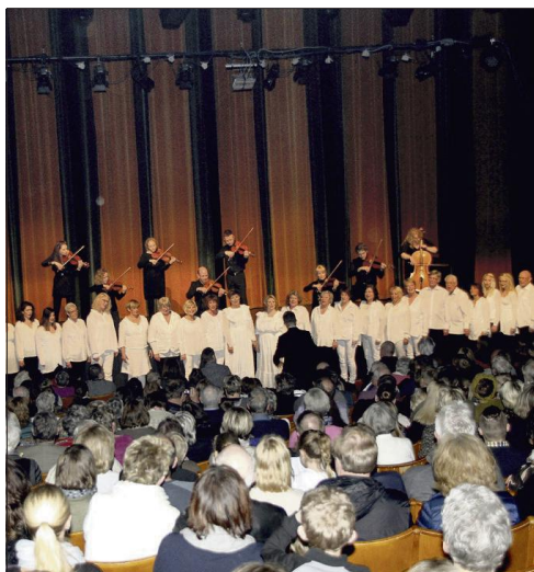
SWINGLETT: Hvitklede Swinglett under åpningen på Biorama.