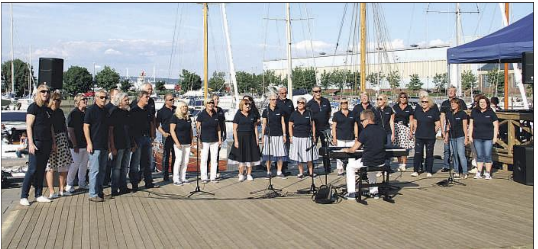
MINITURNÉÉN som Swinglett hadde lagt opp til startet på Fiskebrygga med skuffende liten oppslutning av publikum torsdag ettermiddag.