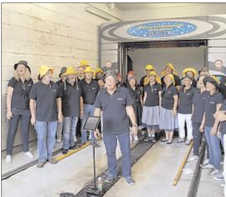
SWINGLETT: Det låt imponerende bra da Swinglett sang i vaskehallen på bensinstasjonen i sentrum.

Swingletts miniturné torsdag hadde fortjent større publikumsoppslutning enn det var.