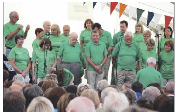
PÅ BESØK: Irske Capella hadde mye på sitt repertoar.